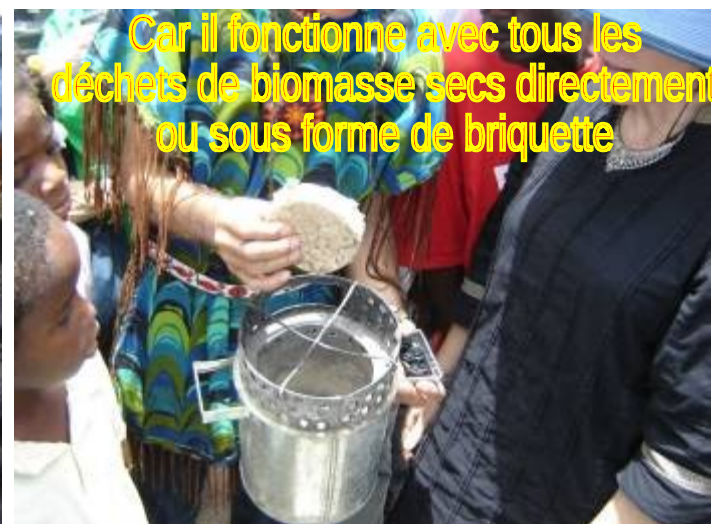
Car il fonctionne avec tous les déchets de biomasse secs directement ou sous forme de brique