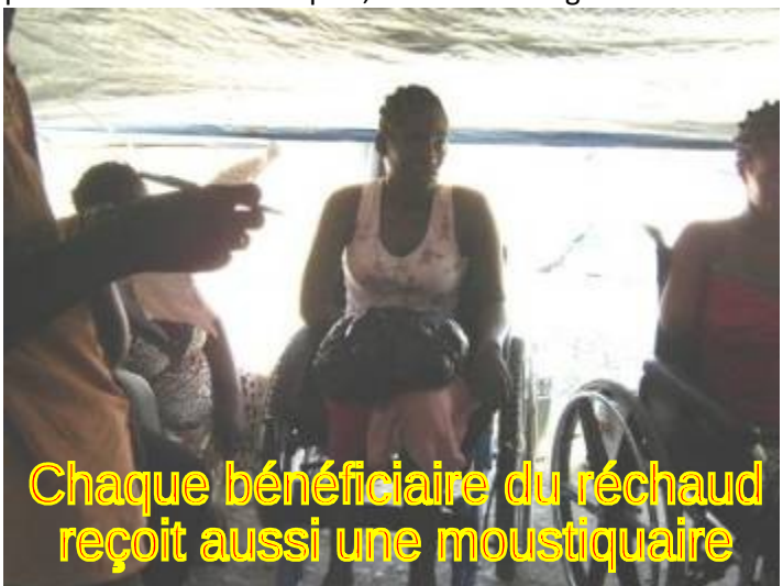
Chaque bénéficiaire du réchaud reçoit aussi une moustiquaire

Aussi, pour témoigner de leur compassion aux nouveaux handicapés victimes du séisme, les membres de Terre des Jeunes Delmas décident d'offrir les 11 réchauds restant (avec 100 briquettes) aux handicapés prioritaires sélectionnés par Handicap International. En plus, il leur est donné une moustiquaire et une plantule de fruitier. De plus, des fruits et légumes séchés sont offerts pour les tous les 40 handicapés du camp. En plus, il leur est donné une moustiquaire et une plantule de fruitier. De plus, des fruits et légumes séchés sont offerts pour les tous les 40 handicapés du camp.