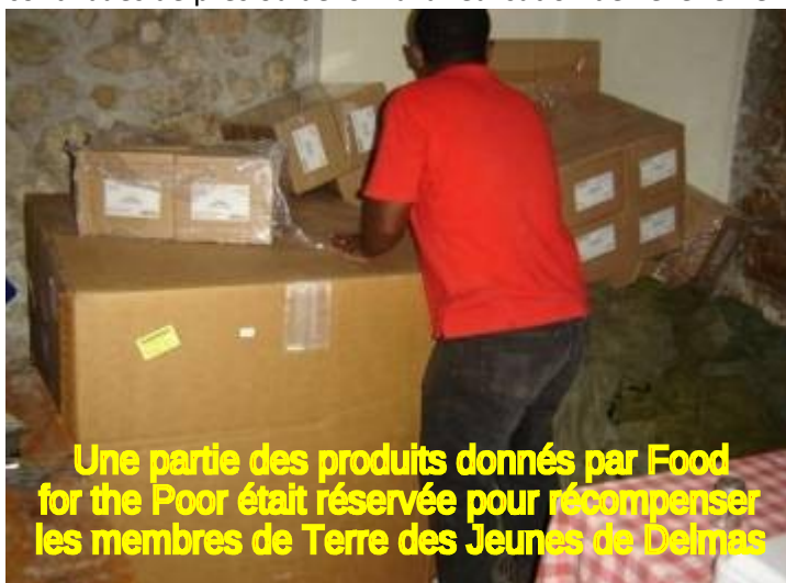
Une partie des produits donnés par Food for the Poor était réservée pour récompenser les membres de Terre des Jeunes de Delmas

Les membres du Comité de Terre des Jeunes Delmas organisent la remise des lots pour leurs membres et amis qui ont contribué de près ou de loin à la réalisation de l'événement.