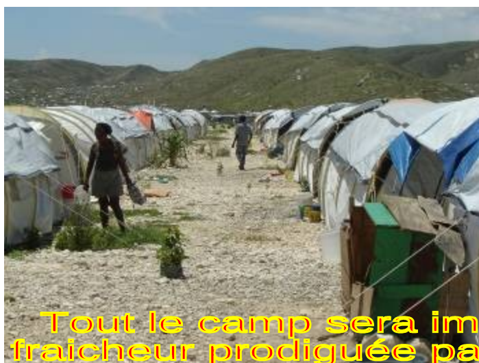
Tout le camp sera imprégné d'une nouvelle fraîcheur prodiguée par l'ensemble des arbres