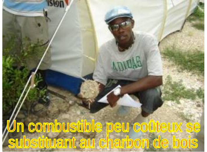
Un combustible peu coûteux se substituant au charbon de bois