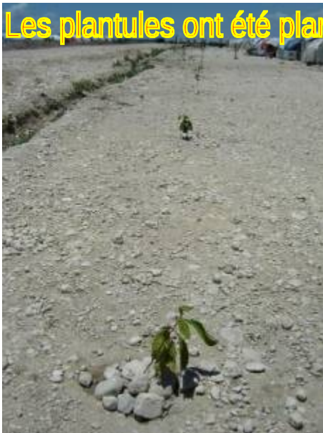
Les plantules ont été plantées autour du camp et sur les grands axes internes