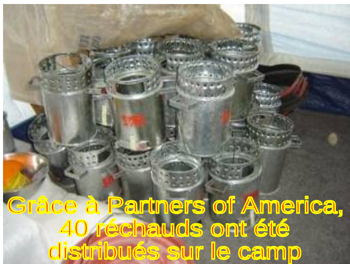
Grâce à Partners of America, 40 réchauds ont été distribués sur le camp