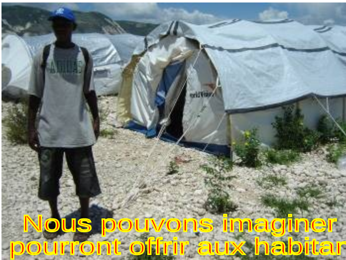
Nous pouvons imaginer l'ombrage que ces arbres pourront offrir aux habitants quand ils seront grands