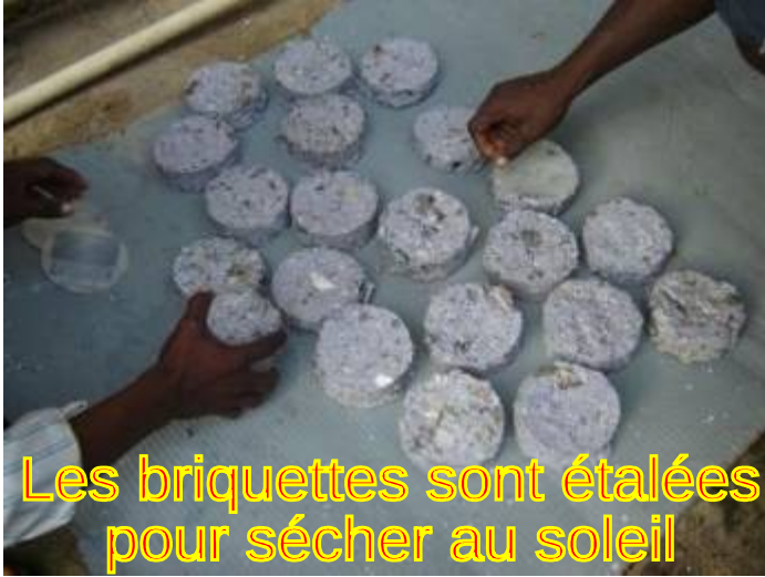
Les briquettes sont étalées pour sécher au soleil

Ils sont déchiquetés et mélangés avec de la sciure de bois et le tout trempé dans de l'eau. Une quantité est placée dans un morceau de PVC percé de trous et comprimée à l'aide d'un piston à main en bois. La galette obtenue est mise à sécher au soleil et en 3 jours on obtient des briquettes prêtes à brûler dans le réchaud.