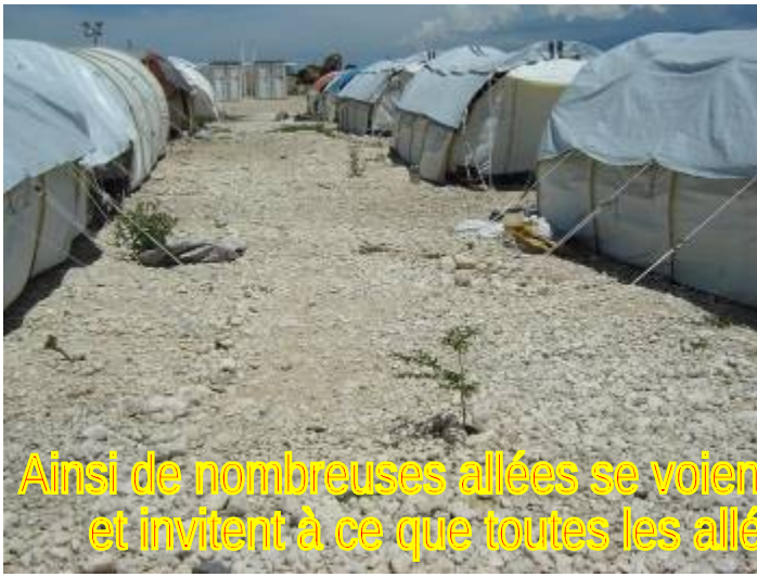
Ainsi de nombreuses allées se voient transformées en espaces de verdure et invitent à ce que toutes les allées du camp deviennent de la sorte