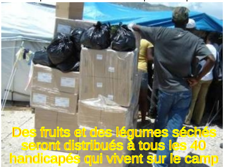
Des fruits et des légumes séchés seront distribués à tous les 40 handicapés qui vivent sur le camp