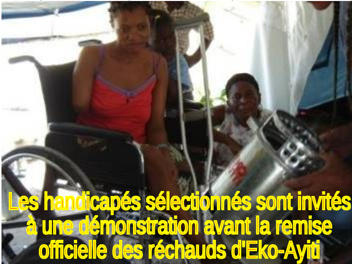
Les handicapés sélectionnés sont invités à une démonstration avant la remise officielle des réchauds d'Eko-Ayiti

Étant donné que pour la journée terminale de la Fête de l'Arbre Eko-Ayiti a pu, grâce à un financement de PRODEV et de la Société Audubon, redonner 24 réchauds à pyrolyse de biomasse (et 100 briquettes pour chaque) pour la population de Corail, Terre des Jeunes Delmas a choisi d'en donner un à chacun des 13 membres du Comité Terre des Jeunes de Corail pour les récompenser de leur implication tout au long de la Fête de l'Arbre.