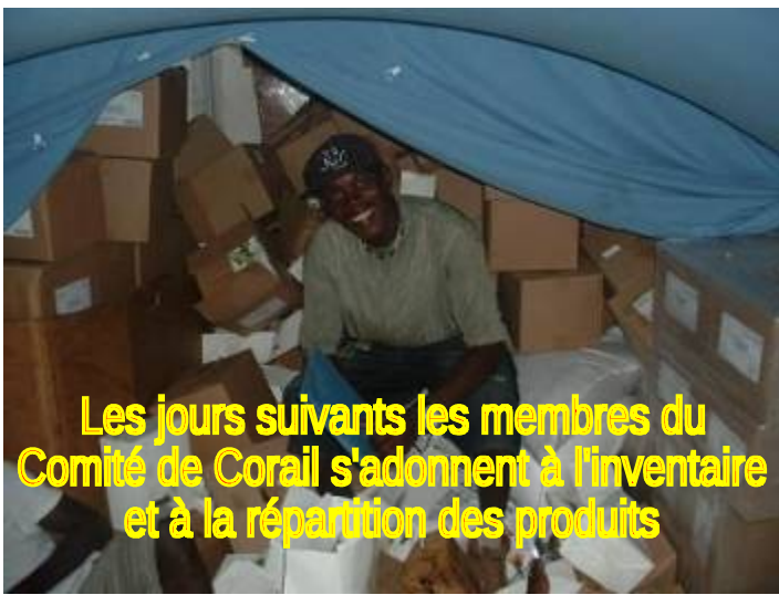
Les jours suivants les membres du Comité de Corail s'adonnent à l'inventaire et à la répartition des produits