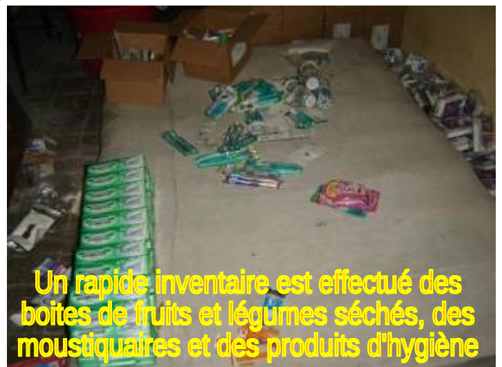
Un rapide inventaire est effectué des boîtes de fruits et légumes séchés, des moustiquaires et des produits d'hygiène