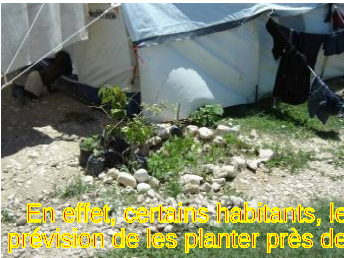
En effet, certains habitants, les gardent dans les sachets en prévision de les planter près de leur future maison plus durable