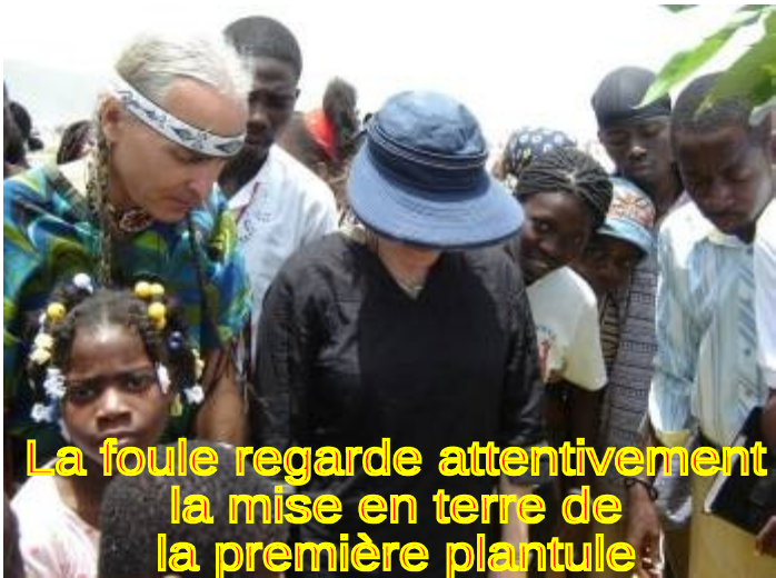
La foule regarde attentivement la mise en terre de la première plantule