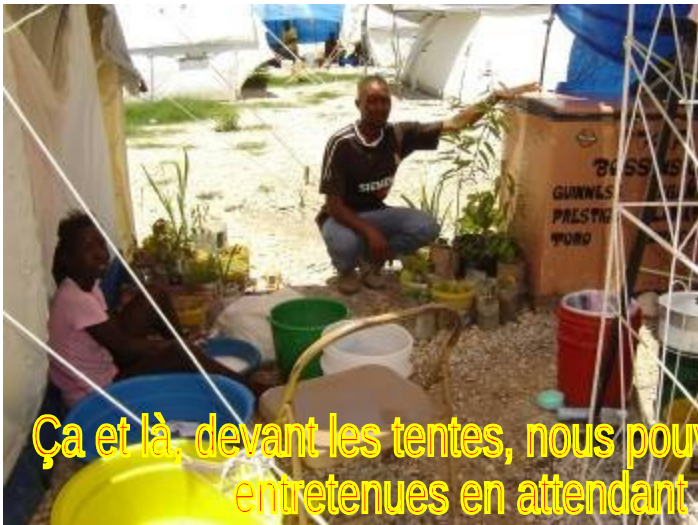
Ça et là, devant les tentes, nous pouvons voir des plantules précieusement entretenues en attendant leur mise en terre définitive