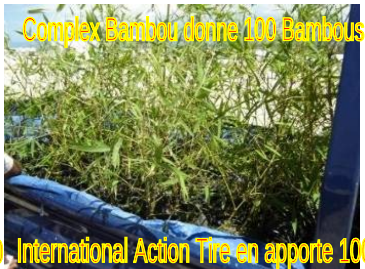
Complex Bambou donne 100 Bambous