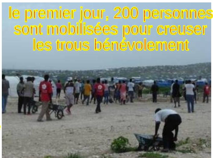
le premier jour, 200 personnes sont mobilisées pour creuser les trous bénévolement