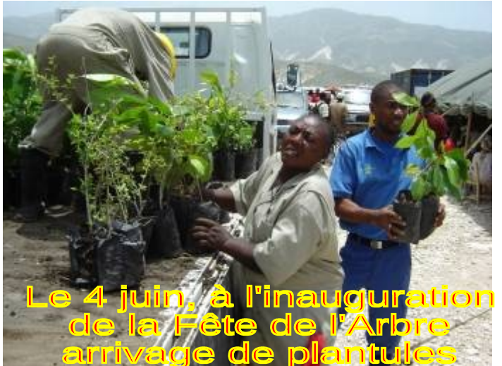
Le 4 juin, à l'inauguration de la Fête de l'Arbre arrivage de plantules