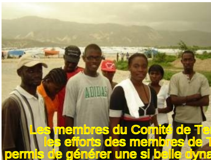
Les membres du Comité de Terre des Jeunes de Corail saluent les efforts des membres de TDJ de Delmas pour leur avoir permis de générer une si belle dynamique sur leur nouvel espace de vie

Ainsi se termine la Fête de l'Arbre 2010 au Camp de Corail Cesse Lesse. Un dessin animé en créole en DVD : « L'Homme qui plantait des Arbres » adapté du roman de l'écrivain français Jean Giono, fourni par Terre des Jeunes, n'avait pas pu être diffusé au public de Corail le 27 juin à cause de la pluie. Aussi, il a été confié à Télé-Mobile pour l'intégrer à sa programmation pour qu'il puisse passer dans les 13 camps où Télé-Mobile est présente.