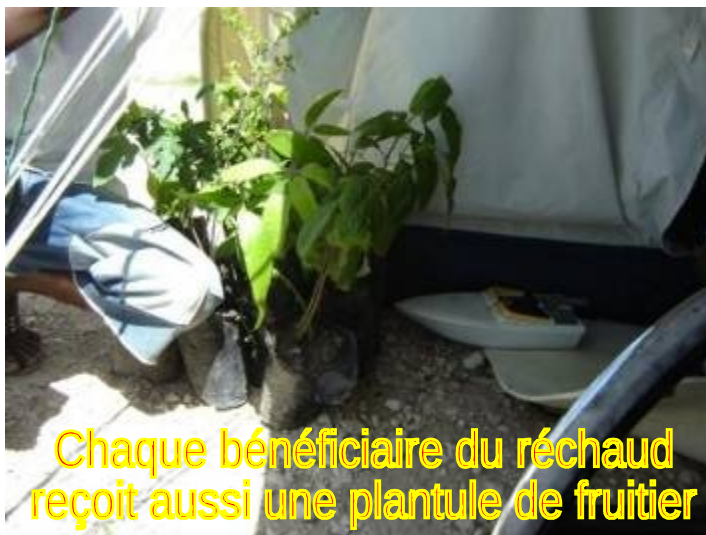
Chaque bénéficiaire du réchaud reçoit aussi une plantule de fruitier