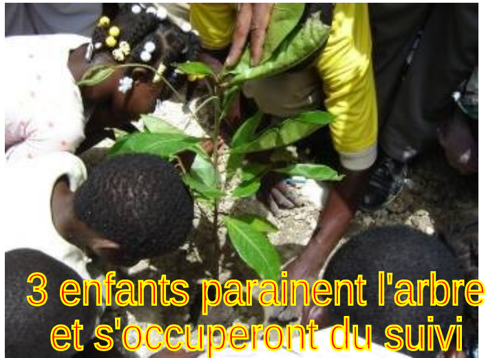
3 enfants parainent l'arbre et s'occuperont du suivi