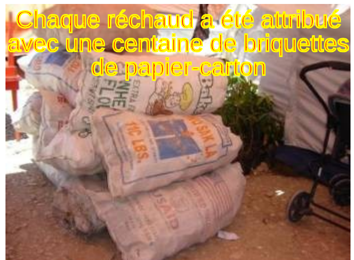
Chaque réchaud a été attribué avec une centaine de briquettes de papier-carton

Grâce à ce réchaud, nous pouvons espérer un grand pas en avant pour la lutte contre le déboisement dû à la fabrication du charbon de bois.