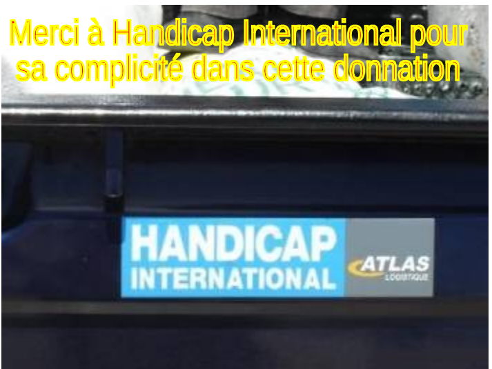
Merci à Handicap International pour sa complicité dans cette donation

Ainsi se termine la Fête de l'Arbre 2010 au Camp de Corail Cesse Lesse. Un dessin animé en créole en DVD : « L'Homme qui plantait des Arbres » adapté du roman de l'écrivain français Jean Giono, fourni par Terre des Jeunes, n'avait pas pu être diffusé au public de Corail le 27 juin à cause de la pluie. Aussi, il a été confié à Télé-Mobile pour l'intégrer à sa programmation pour qu'il puisse passer dans les 13 camps où Télé-Mobile est présente.