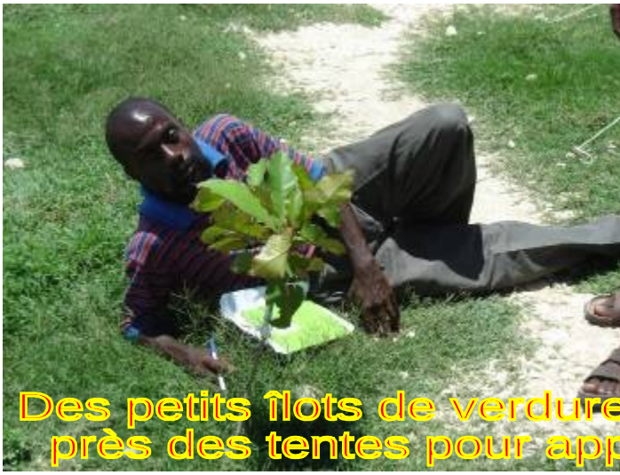
Des petits îlots de verdure commencent à apparaître près des tentes pour apporter un peu de fraîcheur