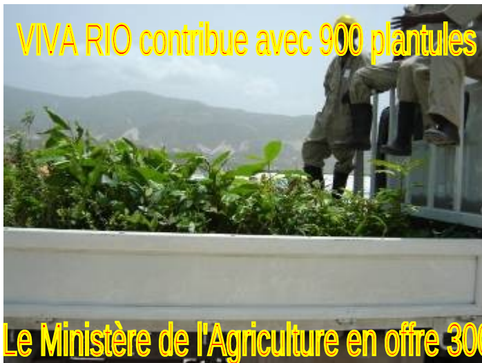
VIVA RIO contribue avec 900 plantules