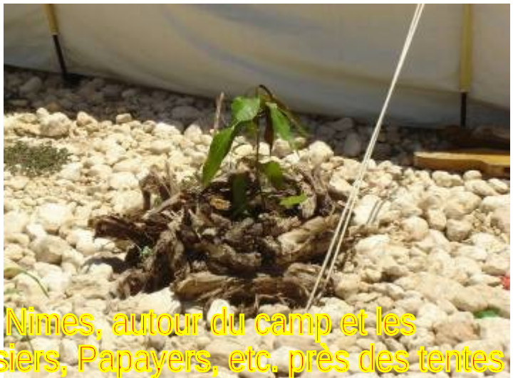
Amandiers du Niger, Acajous, Nimes, autour du camp et les fruitiers : Orangers, Manguiers, Cerisiers, Papayers, etc. près des tentes