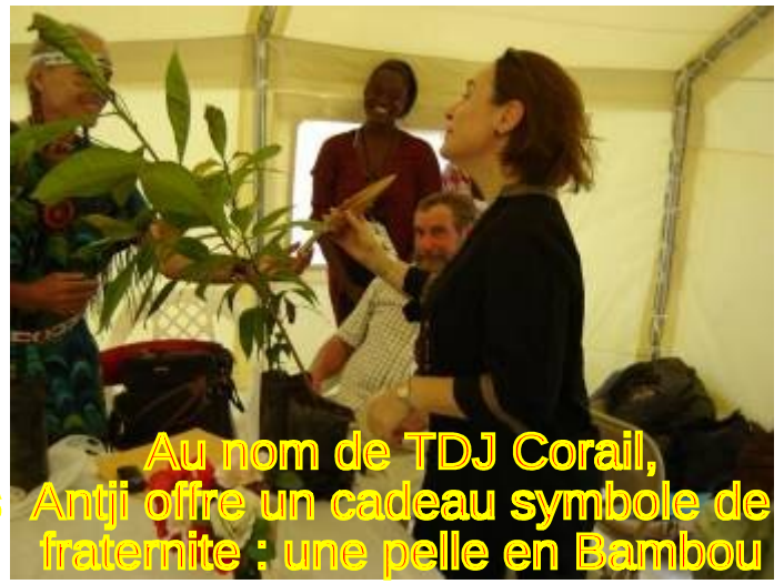
Au nom de TDJ Corail, Antji offre un cadeau symbole de fraternité : une pelle en Bambou