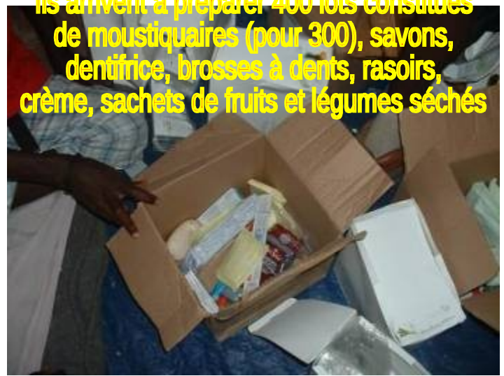
Ils arrivent à préparer 400 lots constitués de moustiquaires (pour 300), savons, dentifrice, brosses à dents, rasoirs, crème, sachets de fruits et légumes séchés