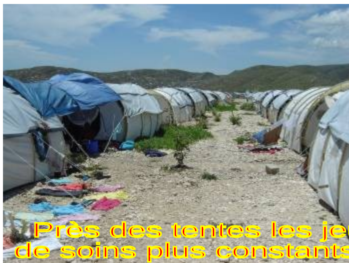
Près des tentes les jeunes arbres bénéficient de soins plus constants de la part des habitants