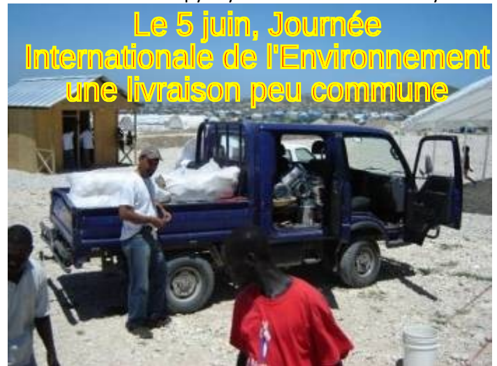
Le 5 juin, Journée Internationale de l'Environnement une livraison peu commune