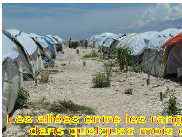
Les allées entre les rangées de tentes deviendront dans quelques mois des couloirs de verdure