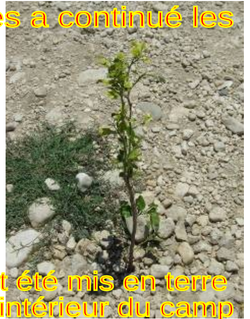
plantations et 200 autres arbres ont été mis en terre le long des canaux extérieurs et à l'intérieur du camp