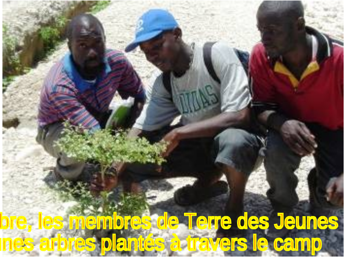
2 mois après la finale de la Fête de l'Arbre, les membres de Terre des Jeunes de Corail sont fiers de montrer les jeunes arbres plantés à travers le camp

Après le 27 juin, Terre des Jeunes a continué les