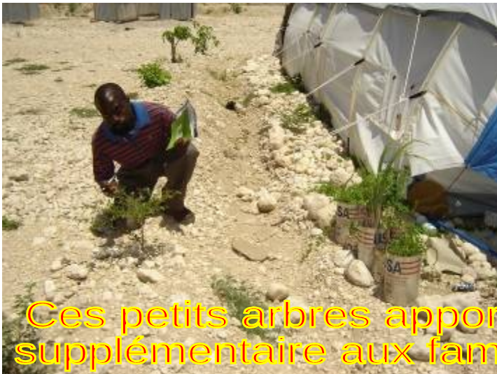
Ces petits arbres apportent une touche d'espoir supplémentaire aux familles vivant dans le camp