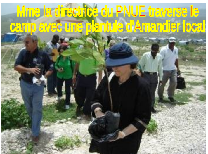
Mme la directrice du PNUE traverse le camp avec une plantule d'Amandier local

Le 4 juin a été la journée inaugurale avec la visite de la délégation