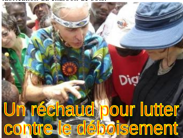
Un réchaud pour lutter contre le déboisement

Grâce à ce réchaud, nous pouvons espérer un grand pas en avant pour la lutte contre le déboisement dû à la fabrication du charbon de bois.